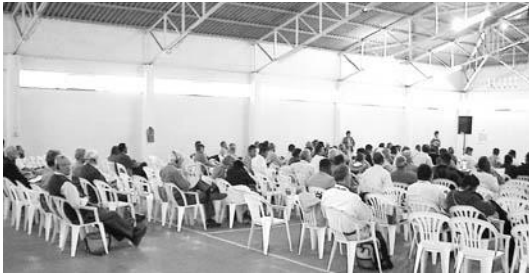
Foto: En su última sesión, el domingo 17 de agosto, el Concilio General recibió los informes del Comité de Paz y el Comité de Fe y Vida.

El Concilio General del Congreso Mundial Menonita recibió este informe del Comité de Paz, para someter a estudio y decidir en su sesión de 2006 si adoptar las recomendaciones que incluye.