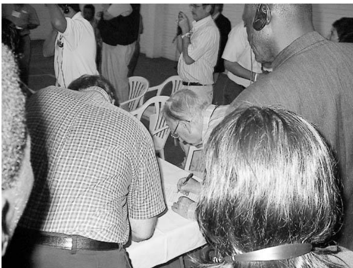
Foto: Los delegados de iglesias y agencias misioneras firman el acta de constitución de la Fraternidad Mundial Misionera.

La FMM pretende ser un espacio donde compartir visión e información sobre proyectos concretos, a fin de fomentar una estrecha colaboración entre distintas iglesias nacionales, incluso entre las diversas denominaciones anabaptistas asociadas en la FMM, para que no acabemos duplicando esfuerzos o, peor, compitiendo unos con otros en un mismo lugar. ¡Dios quiera que esto constituya todo un relanzamiento de la visión y la labor misionera en clave anabaptista!