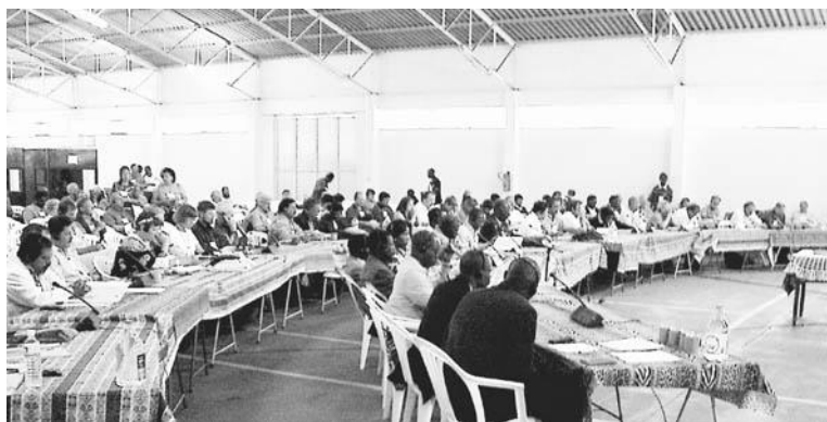
Foto: Reunión del Comité de Fe y Vida del CMM.

Un grupo de trabajo venía trabajando desde hace varios años recopilando resúmenes de las convicciones medulares de las iglesias que optaron por participar. Dicho grupo redactó un primer borrador que se sometió a debate del Comité de Fe y Vida en pleno durante el CMM en Bulawayo. El resultado de este debate es este segundo borrador, que se someterá ahora a un proceso de estudio y discernimiento en las iglesias miembro del CMM, con vistas a la adopción de una afirmación de