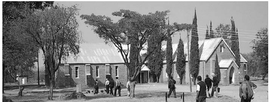
Fotos: Chozas típicas e iglesia rural en Matopo, sede de la primera misión de los Hermanos en Cristo en Zimbabwe

El Congreso Mundial Menonita se reunió en Zimbabwe con muchas dudas ante la situación política, social, sanitaria y económica del país. Al final se celebró allí porque los representantes de la iglesia Hermanos en Cristo anfitriona insistieron que para ellos sería una muestra de solidaridad fraternal internacional de enorme valor. Los cristianos de Zimbabwe de todas las denominaciones agradecieron la celebración del CMM en su país, considerando que marcaría un antes y un después en el clima espiritual de su nación. Por propia iniciativa de los cristianos de Zimbabwe, el Concilio General del CMM adoptó la siguiente declaración, a la que éstos esperan dar la más amplia difusión por todos los medios de comunicación, con la esperanza de influir para beneficio de su país: