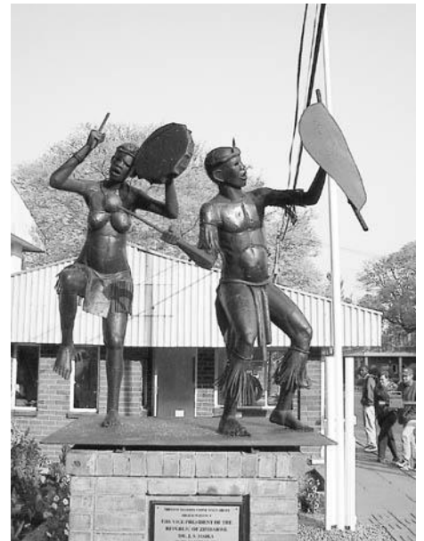
Foto: Para la Cumbre Mundial de la Juventud y las sesiones iniciales del Concilio General, la sede fue la Escuela Politécnica de Bulawayo, cuya entrada lucía esta sugerente escultura africana.

cación que permitan a los jóvenes mantenerse en contacto