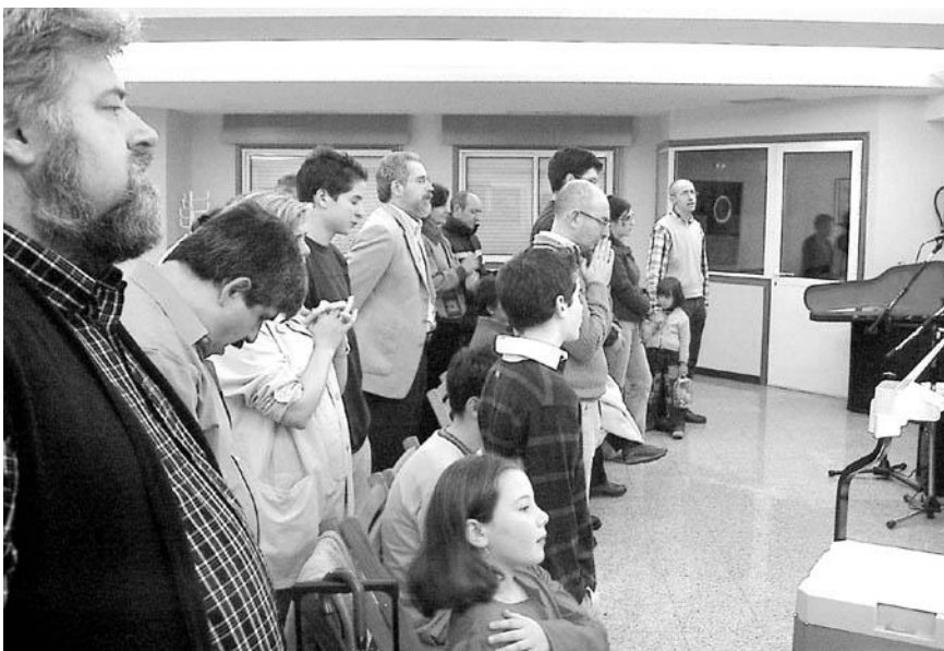
Vigo, 22 nov. — (arriba:) Vista parcial del salón de actos del local de la calle Pi y Margall, donde ahora se reúne la Iglesia Horeb . (abajo:) Algunos de los integrantes del «Grupo de Colaboradores» de la iglesia.