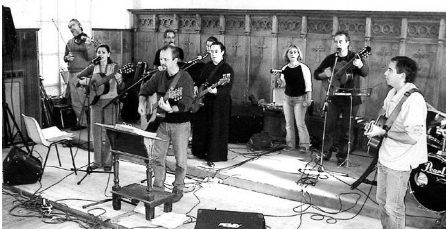
Un momento de la alabanza, retiro de la iglesia de Burgos

EL MENSAJERO es una publicación de la Secretaría de la AMyHCE (Asociación de Menonitas y Hermanos en Cristo en España)