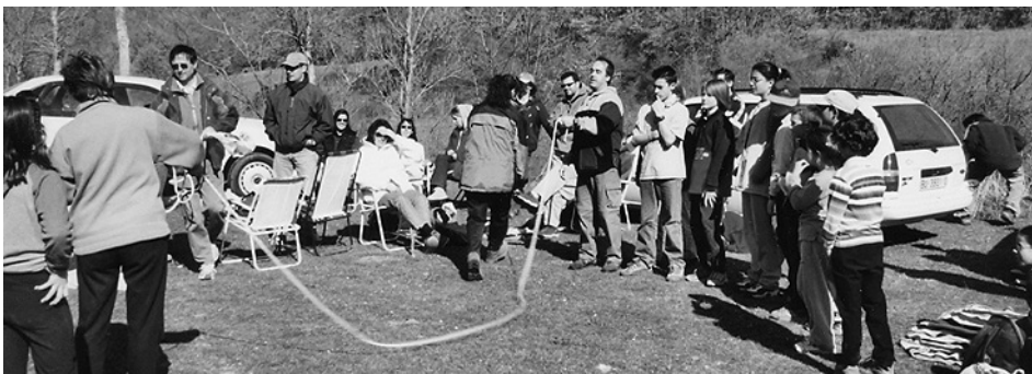
Varias de las familias de Burgos, en una de nuestras incontables salidas al campo.