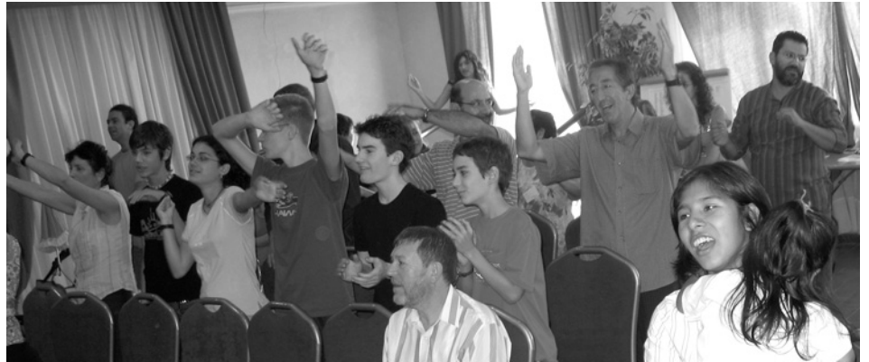
En retiros de iglesia como nuestros Encuentros Menonitas Españoles cada dos años, los chicos se lo suelen pasar tan bien como los mayores.

Observo que cada vez más se tiende a resolver esa tensión con un: «Hemos decidido que lo primero es la