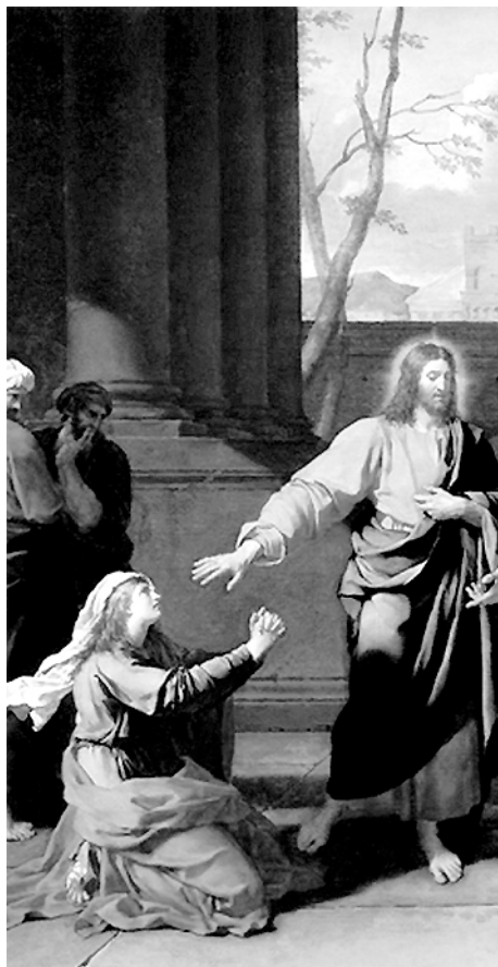
Cristo y la mujer cananea (detalle) Cuadro de Drouais (1784)

orígenes o caminos escogidos. Aprendí con él que todo ser humano es mi hermano, mi hermana, que sólo el Dios de la vida es universal, y no el dios tribal de mi grupo.