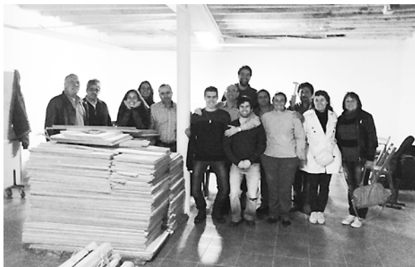
Nuevo local de la iglesia en Vigo