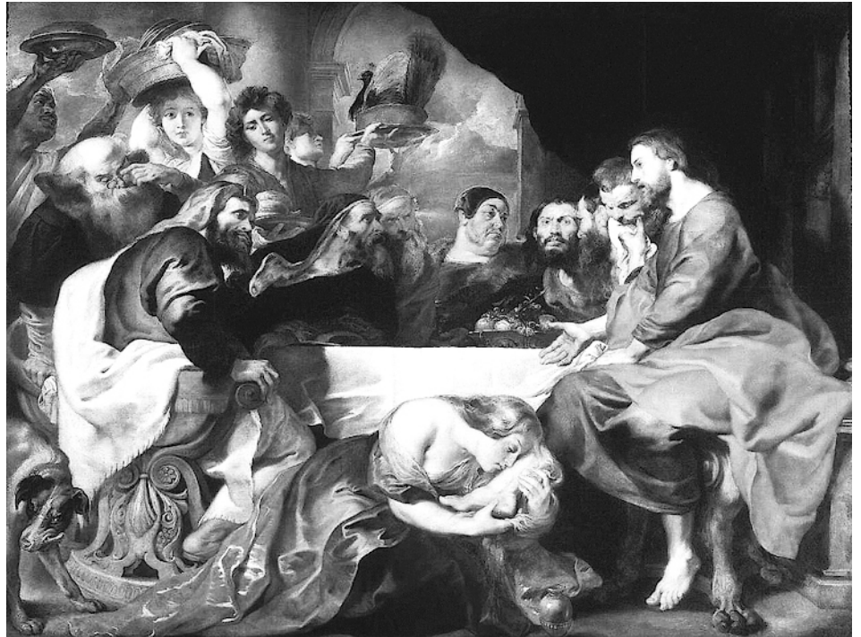
Cuadro de Peter Paul Rubens (1629)

De esta manera, nunca vamos a conocer a Jesús.