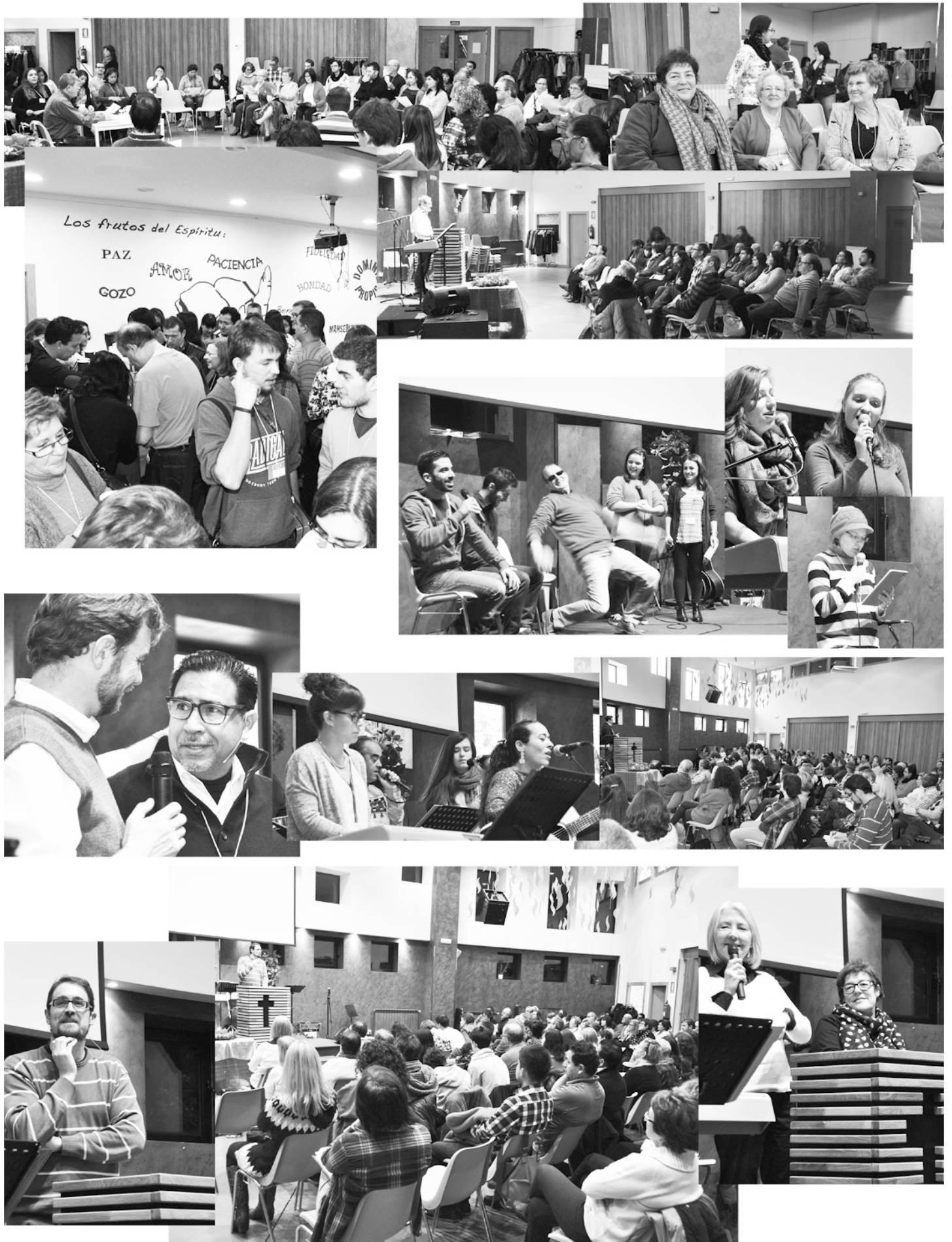
Página 1. Viernes. Llegada, recepción Viernes. Reunión a cargo de jóvenes