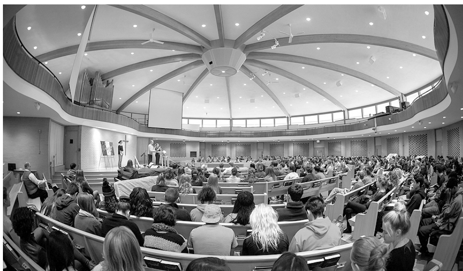
Iglesia menonita hoy día (Indiana, EEUU). Los tópicos de rusticidad agraria del pasado ya no son útiles, porque los menonitas nos desenvolvemos con naturalidad en todas las sociedades y en todo tipo de actividad y profesión.

Llamarnos unos católicos, otros luteranos, otros metodistas o bautistas o pentecostales —y sí, también, otros menonitas— no tiene entonces nada de negativo o perjudicial para la iglesia, a no ser que con ello alguien quiera señalar un desprecio del prójimo. Y desde luego no es menos virtuoso que pretender ser cristianos «de marca blanca», genéricos, donde es imposible precisar su origen ni su