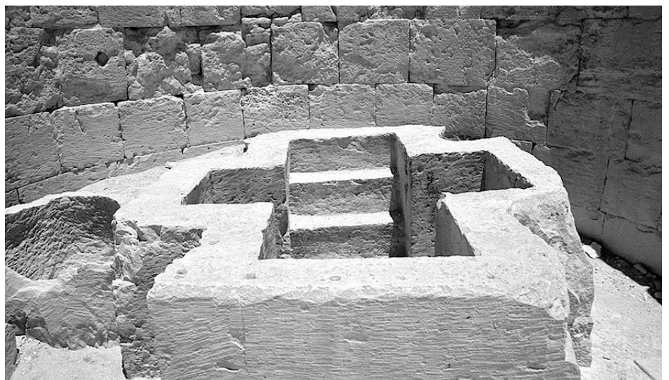
Bautisterio de los primeros siglos del cristianismo, en el Neguev (Israel). La persona que se bautizaba descendía por los escalones de un lado y salía por los del otro. El espacio del salón era limitado, los testigos muy pocos y la luz tenue, por la desnudez necesaria para este baño cristiano de purificación ritual.