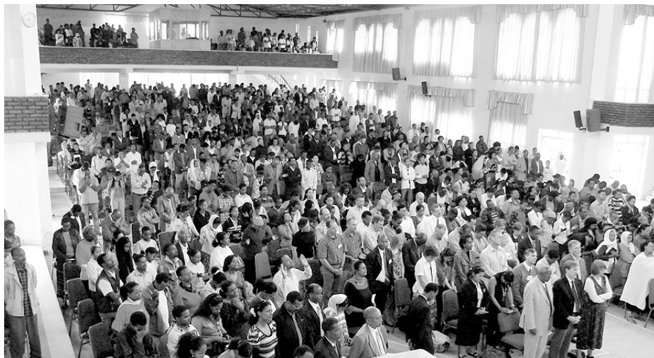
Iglesia Meserete Kristos (Etiopía). Hoy los menonitas somos una red internacional y multirracial de iglesias, presentes en todos los continentes.

composición teológica. Entiendo que esto último también es respetable dentro de la diversidad, pero no que se pretenda que es superior.