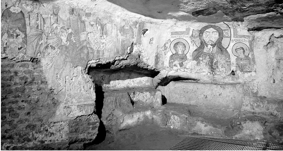
En los primeros siglos, los cristianos de Roma se reunían clandestinamente en las catacumbas —excavaciones subterráneas para la sepultura de los muertos.

—como era característico en la informalidad de la 1ª etapa— había decidido adherirse a la comunidad cristiana, se dirigía a un amigo o promotor, que una mañana cualquiera lo acompañaba a conocer a los maestros cristianos antes de una de las sesiones catequísticas habituales. En este primer encuentro o «escrutinio», que era necesario para pasar a la 2ª etapa, los maestros no recibían con brazos abiertos a los candidatos en potencia. Al contrario, preguntaban insistentemente, tanto a la persona que los promovía como al propio candidato en potencia, acerca del rango social, la ocupación y la conducta del candidato.