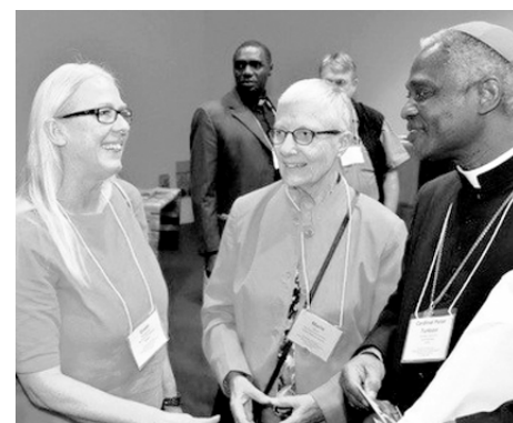
Algunos participantes del congreso en Roma.

Una crítica esencial de la teoría de la guerra justa —que durante más de 1.500 años ha sido la lógica y la ética que enuncian los parámetros donde se