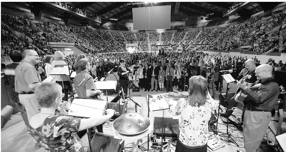
Congreso Mundial Menonita (Pensilvania, EEUU, 2015).

Desde luego si otros —mi iglesia local a la que pertenezco, sin ir más lejos— prefieren identificarse como anabautistas, estoy dispuesto a asumiirlo. Aunque me parezca injusto con las largas generaciones de menonitas que mantuvieron la fe a lo largo de medio milenio, entiendo que estas cosas a veces adquieren peso propio y que el neologismo «anabautistas» puede acabar siendo —para otros ya que no para mí— la palabra con que se prefieran identificar dentro de la maravillosa diversidad de la familia cristiana.