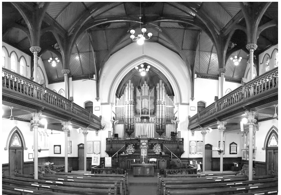
El órgano de tubos, un elemento embellecedor frecuente en iglesias evangélicas.

Censura el insigne pensador «la ausencia de imágenes y metáforas, de toda poesía» que caracteriza al protestantismo en general, principalmente a los calvinistas, a quienes ve como «gentes tristes, graves y secamente austeras, hostiles al goce». Por el contrario, afirma, el alma del católico es figurativa, disfruta de la vida porque se siente tranquilo con el mundo y con Dios, protegido por la Iglesia e