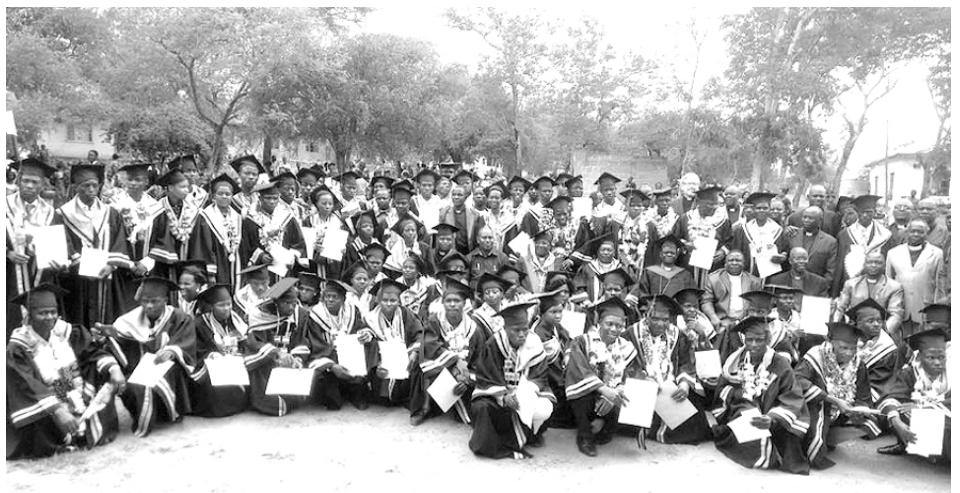
Los noventa estudiantes graduados de la Escuela Universitaria Menonita de Teología de Tanzania.

Con el crecimiento de MTCEA a lo largo de 2017 bajo la supervisión de KMT, todo esto se consiguió sin