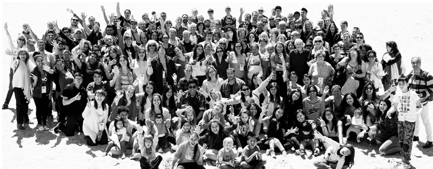
Encuentro Menonita Español, 2017